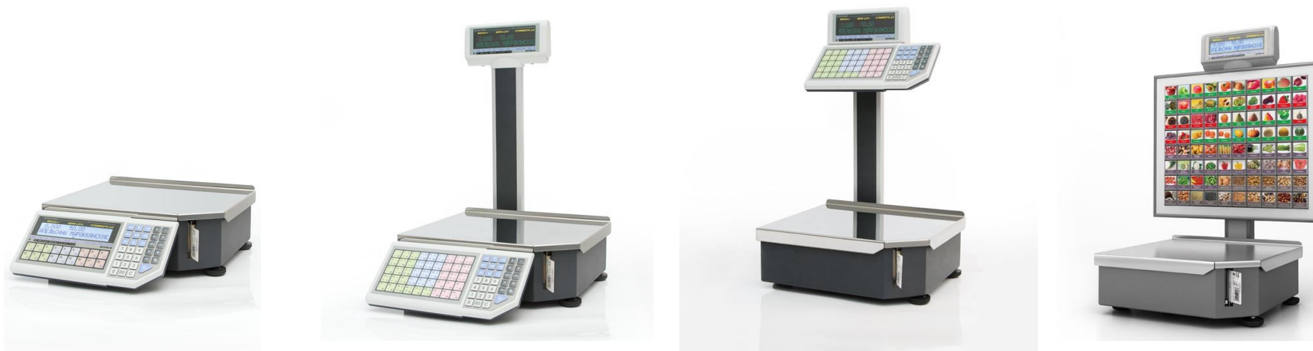
Штрих-Принт Ф1 4.5

Весы с печатью этикетки Штрих-ПРИНТ – превосходная комбинация аппаратной начинки, которая выдержала испытание временем, и нового привлекательного дизайна – эстетичного и практичного. Ограниченное количество конструктивных элементов порождают набор исполнений, предназначенных для различных сфер – от фасовки до работы через прилавок.