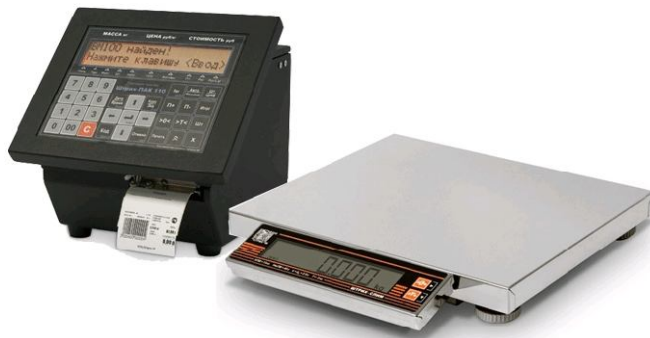
Принтер для весов ШТРИХ-ПАК 110

Для решения специализированных задач ШТРИХ-М разработал специальный принтер печати этикеток, который в комплекте с весами серии ШТРИХ-СЛИМ и настольных весов серии ШТРИХ-МП позволяет взвешивать и маркировать товары весом от 1 г до 600 кг!